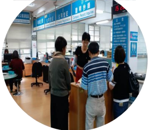
書件齊全 24分鐘領件