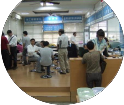
舒適明亮 優質洽公