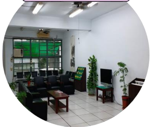
雜誌專區 輕鬆等候