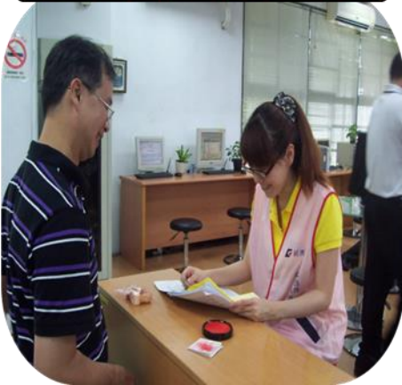
親切友善 快速領件