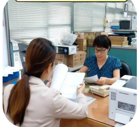
輪值主管 法令諮詢