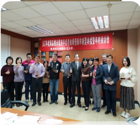
落實商品標示執行