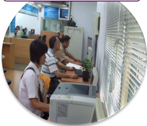
免費上網-全國商工入口網