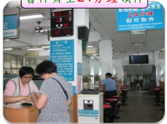
書件齊全 24分鐘領件