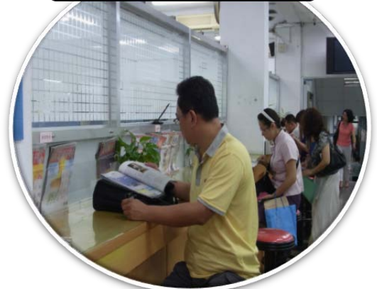
雜誌專區 輕鬆等候