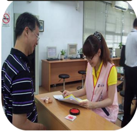
親切友善 快速領件