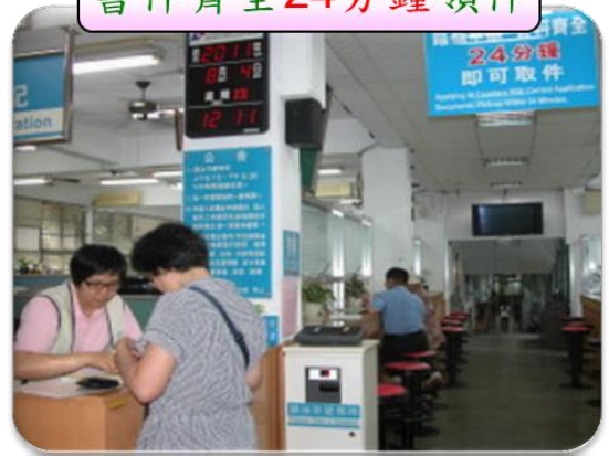
書件齊全 24分鐘領件