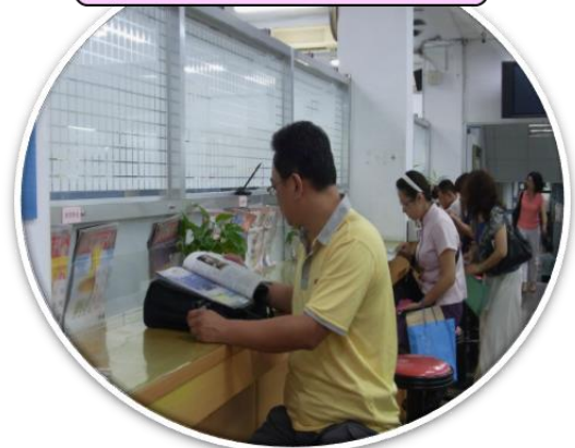
雜誌專區 輕鬆等候