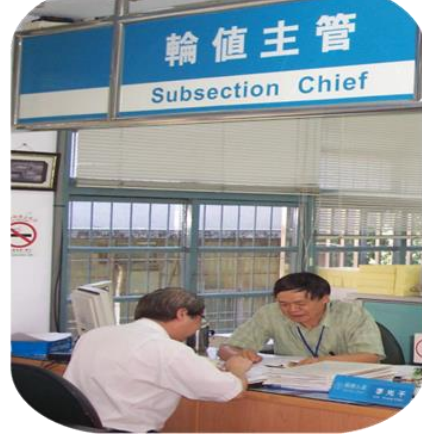
輪值主管 法令諮詢