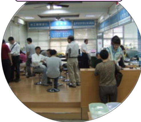
舒適明亮 優質洽公