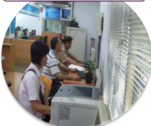
免費上網-全國商工入口網