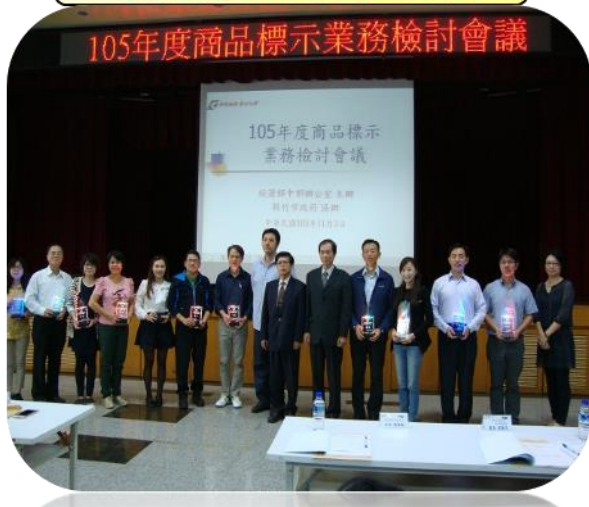
落實商品標示執行