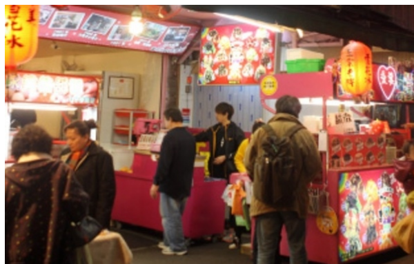
新北市樂華觀光夜市