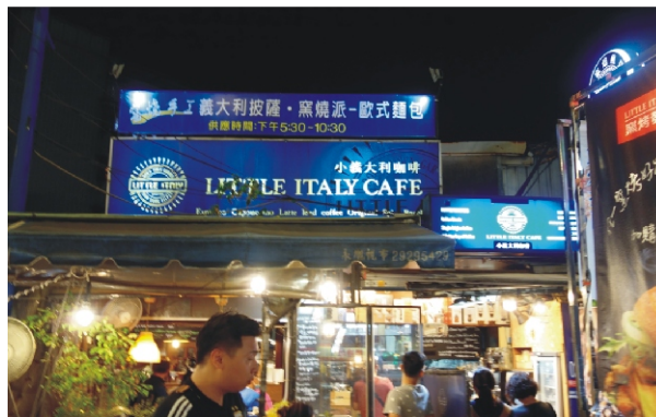
新北市樂華觀光夜市