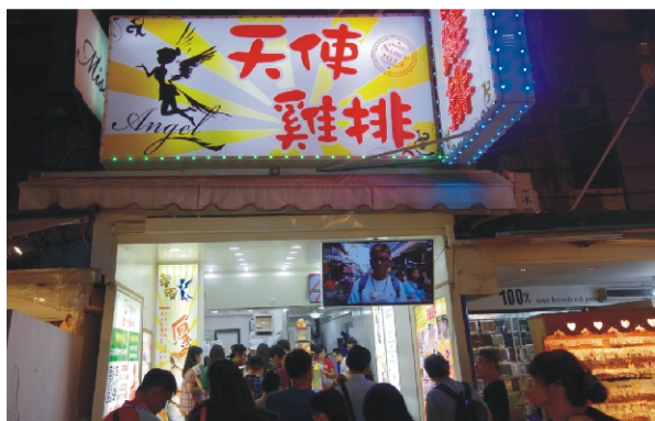
新北市樂華觀光夜市