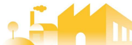
圖一：直轄市、縣(市)政府審查未登記工廠申請納管、提送工廠改善計畫及辦理特定工廠登記之進度