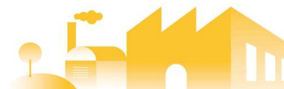
圖一：直轄市、縣(市)政府審查未登記工廠申請納管、提送工廠改善計畫及辦理特定工廠登記之進度